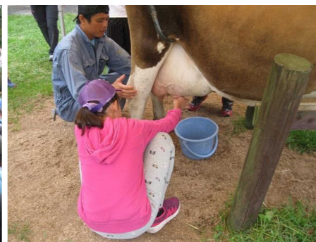
やさしく丁寧にしぼります