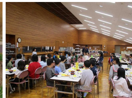
「いただきます」はみんなでそろって

3日目は、リンゴ狩り体験でいろいろな品種を食べ比べ、旧軽井沢銀座では班で計画した買い物をし、出発前よりも荷物がだいぶ重くなりました。お土産だけでなく、思い出もたくさん持ち帰ることができました。