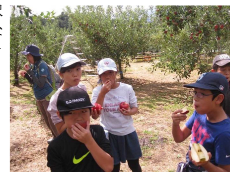
とれたてのリンゴを分け合ってパクリ!

移動教室から帰ってきた後、子どもたちにアンケートをしました。ベスト3を紹介します。