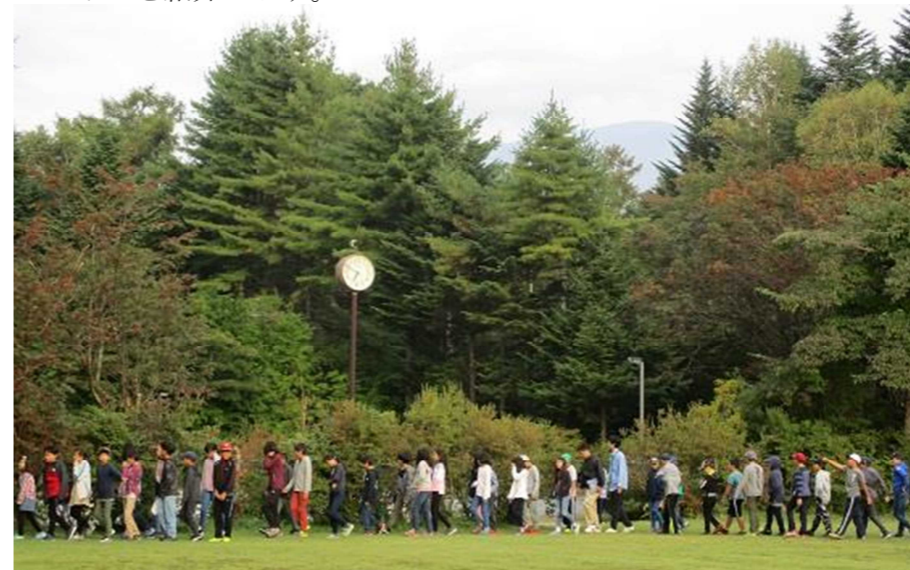
朝会の後、浅間山を見て