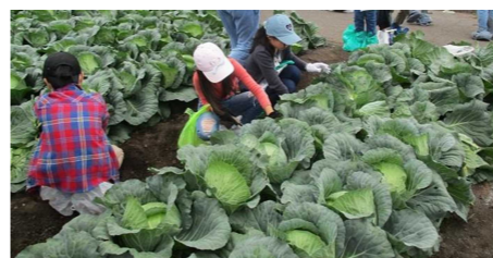
キャベツの収穫体験

2日目は、キャベツ収穫体験をし、穫れたてのキャベツの甘さに驚き、農協の施設や仕事の工夫について話を聞きました。牧場では乳しぼり体験や牛の育ち方の話を聞き、放牧から戻る牛の行進を見学しました。その様子に、子どもたちから感嘆の声が上がりました。白糸の滝では、水の冷たさを直に感じる事ができました。