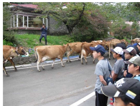
大迫力の牛の行進