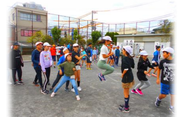
中休みの長縄練習。目標達成に向けて、声を掛け合いました。

12月は、短縄旬間です。いろいろな跳び方にチャレンジして、楽しみながら体力づくりに取り組みます。18日(月)から短縄を使用しますので、用意をお願いします。