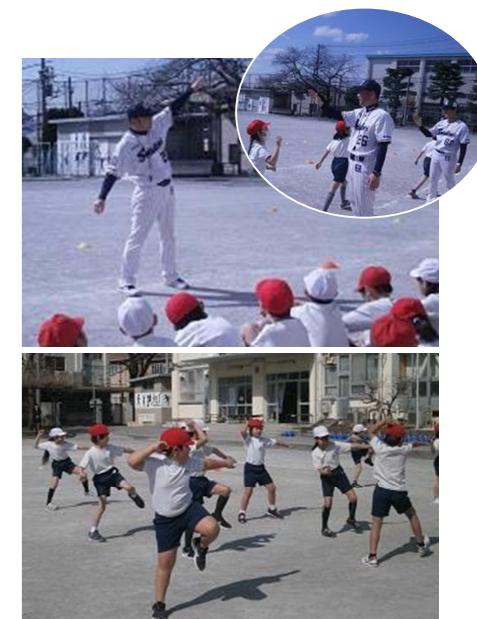
ヤクルトスワローズ投げ方教室を活用し、2年生が、元プロ野球選手から投げ方を学びました。

今年度も、本校の教育活動にご理解とご協力を賜り、誠にありがとうございました。皆様のご支援とご協力に心より感謝申し上げます。今年度最終の学校便りのご挨拶とさせていただきます。