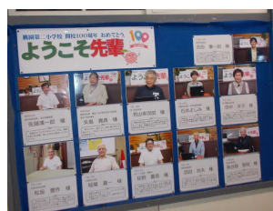
開校100周年記念 ようこそ先輩