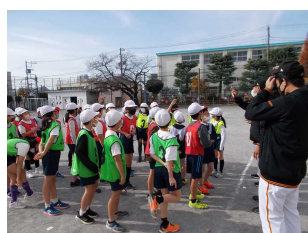
学びに向かう力の育成・体力向上 3・4年 ジャイアンツアカデミー