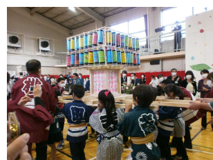
開校100周年記念祝賀会 PTA・地域・同窓会の方々と力を合わせて