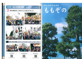
開校100周年記念 記念誌「ももぞの」