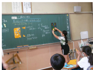
問題解決能力の育成 主体的・対話的な授業研究