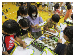
学びに向かう力の育成・知的好奇心 3年生「蝶の授業」