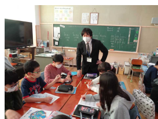
小中連携教育 中学校の先生による授業