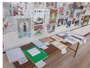
探求心の育成 探求学習作品展