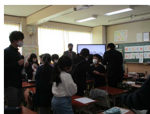
小中連携教育 研究授業と協議会