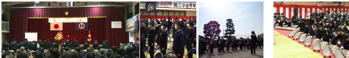
開校100周年記念式典 式典に臨む6年生