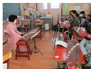
学びに向かう力の育成・伝統文化体験 5年 琴体験