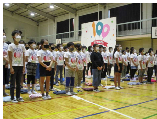
開校100周年記念 児童集会