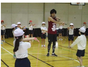
縄跳び教室 ↑ ↓ 演奏会