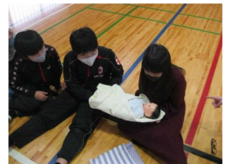
赤ちゃんの人形を抱く5年生

地域に住む専門家や地域の文化・芸術施設等の外部教育力を活用した「地域は学校 地域は先生」特別授業を推進しています。年間50回以上を目標に、各教員が外部の方と折衝して、魅力的で知的好奇心を高める特別授業の実現に努めています。11月だけでも、「ピアノ・バイオリン演奏会」「世界チャンピオンの縄跳び教室」「蝶の授業」「図書ボランティアの方の読み聞かせ」「助産師の命の授業」「清掃事務所の方の環境教室」「能・狂言体験」「中野警察署セーフティ教室」「ファミリーe ルール SNSの賢い使い方の授業」「ブラインドサッカー」を行っています。講師の先生方に対して書いているお礼の手紙に、子どもたちの喜びがあふれています。1年生と6年生の手紙の一部を紹介します。