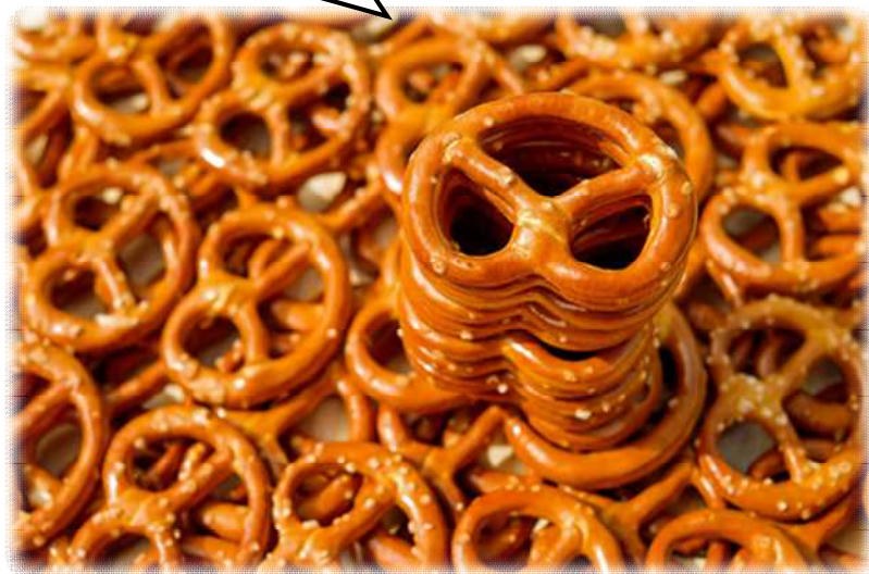
プレッツェル(焼き菓子)