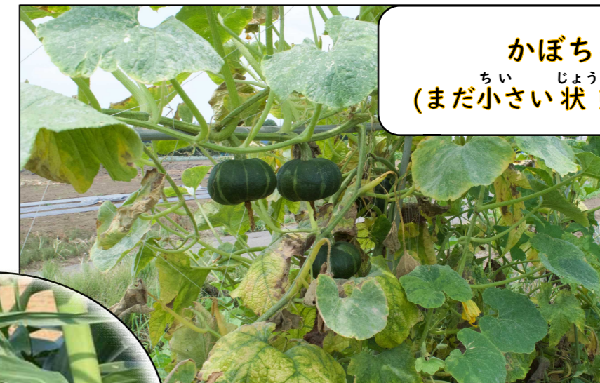
かぼちゃ (まだ小さい状態のもの)