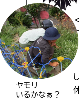
ヤモリ いるかなあ?