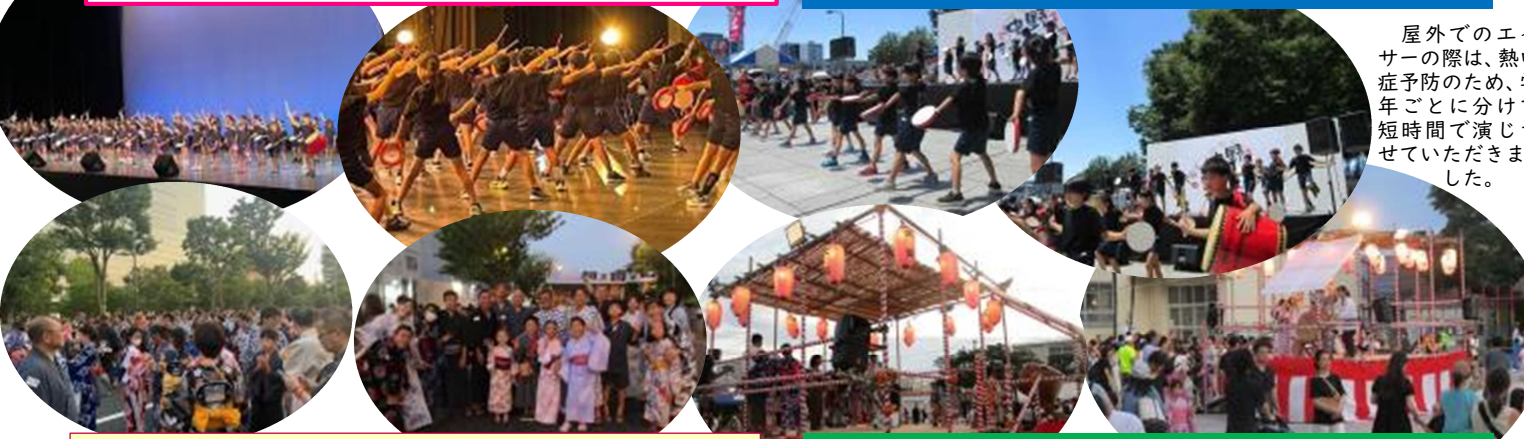
屋外でのエイサーの際は、熱中症予防のため、学年ごとに分けて短時間で演じさせていただきました。