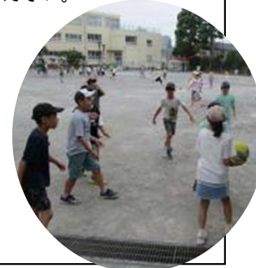
男女分け隔てなく仲良くボール遊び