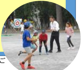
副校長先生とおにごっこ

学校の図書館は、涼しい！ 学校の図書館は、静か！ だから、勉強や宿題がはかどる！ 学校の図書館は、調べるための本がたくさん！ 学校の図書館は、wi-fi が使える！ だから、探求学習をするのに最適！