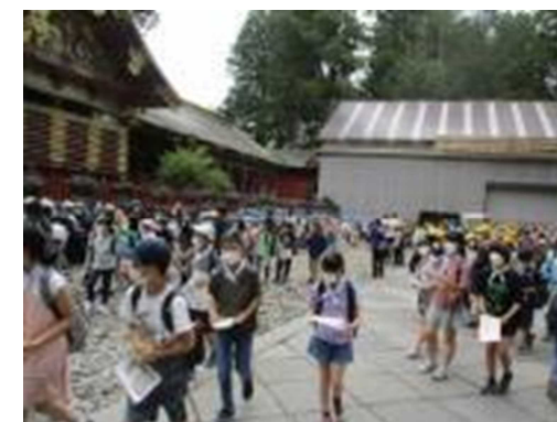
昨年度の日光東照宮（右） 本校のほかにも校帽でない学校もありますが…。

一方で、6月29日には、4年生が車いすラグビー見学のために信濃町駅にある東京体育館へ行き、6年生が劇団四季の舞台を観に東新宿にある東京文化会館へ行きました。2学年分の貸出用校帽の数はありません。6年生は身長があり、自立した行動もとれるので、このときは4年生のみが校帽をかぶって行きました。東京体育館には、20~30の学校が来ていたので、校帽をかぶっていることはとても有効でした。