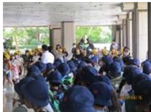
日生劇場の入口 手前の紺色帽子が本校4年生

3年生は、区役所体験の後、サンモール商店街や中野ブロードウェイを見学しました。6年生は毎年恒例の、日光移動教室へ行きました。コロナ禍が明け、どちらの場所も多くの人でにぎわっています。日光東照宮や華厳の滝などの日光の観光名所は、一般客に加え同時に5~10校の小学生が混在することがあります。3年生の見学も、6年生の移動教室も、ご寄贈いただいた校帽を活用することにより、学年のすべての子どもが校帽をかぶることができたので、教員は子どもたちを把握しやすく活動できました。