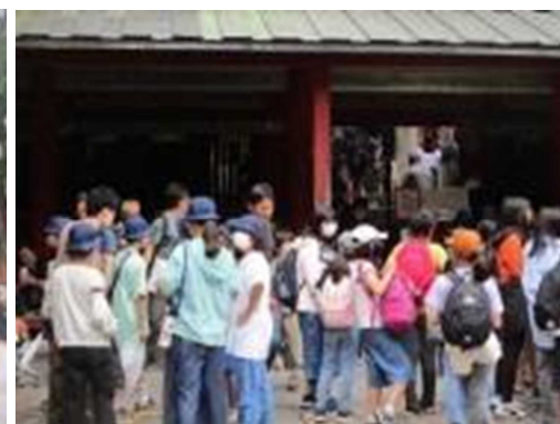
今年の日光東照宮（左の2枚） 紺色の帽子の本校6年生が分かりやすいと思います。