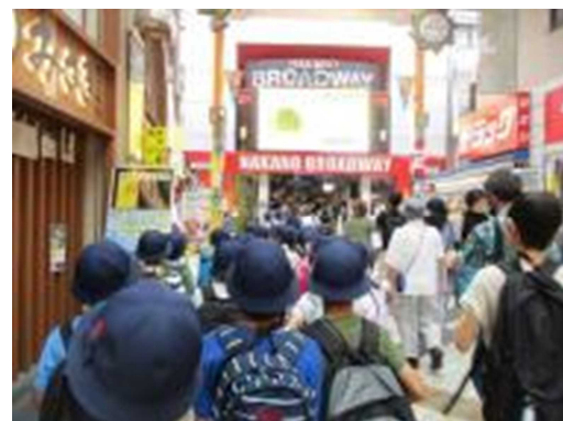
サンモール商店街内