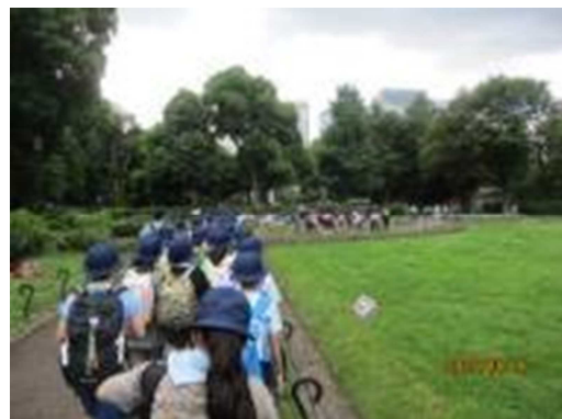
全員が校帽をかぶって日比谷公園を歩く4年生

4年生は、今年度から復活した日生劇場での観劇体験に行きました。地下鉄に乗り、乗降客が多くホームが決して広いとは言えない駅で東西線から千代田線に乗り換えて行きました。大人が多数いる地下鉄内やホーム上では、子どもたちの身長では埋もれてしまいます。列車から降り遅れた子がいなかったか、駅構内の通路で違う方向に行ってしまう子はいなかったか、教員は非常に神経を使います。今年度は、ご寄贈いただいた校帽を活用して、4年生全員が校帽をかぶって行くことができたので、教員は子どもたちを把握しやすくなりました。